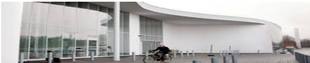
Idrætscentret Birkerød, Bistrupvej 1, Birkerød

Uddrag af køreplan for bus fra Holte til Idrætscentret den 27.2.2018 kl. 19 bagerst i A-nyt