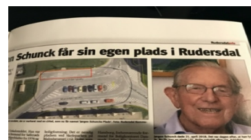
Schuncks Plads, Nærum