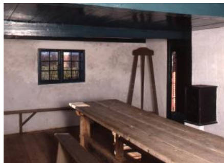
Toftum Skole, Rømø - en af Danmarks mindste skoler.

På Rømø ligger en af Danmarks mindste og ældste skolebygninger, Toftum Skole fra 1784.