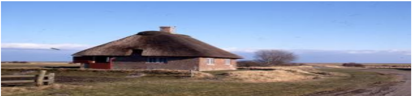
Set i ferien - En af Danmarks ældste skoler fra 1784- se bagerst i A-nyt